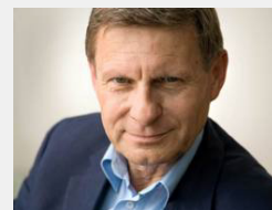
Prof. Dr. Leszek Balcerowicz