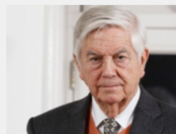
Prof. Frits Bolkestein