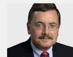
Prof. Dr. Jürgen Stark