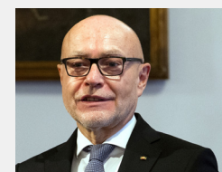
Prof. Dr. Dr. Udo Di Fabio