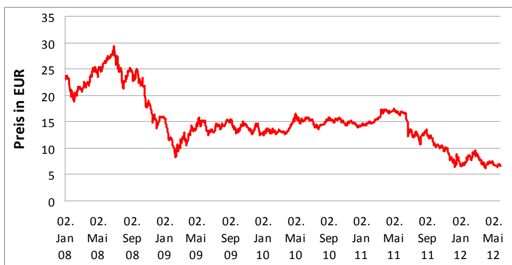
Abbildung 1: Entwicklung des CO 2 -Preises

Quelle: Intercontinental Exchange. Daten für „Front-year“-Futures-Kontrakte mit Lieferung im Dezember